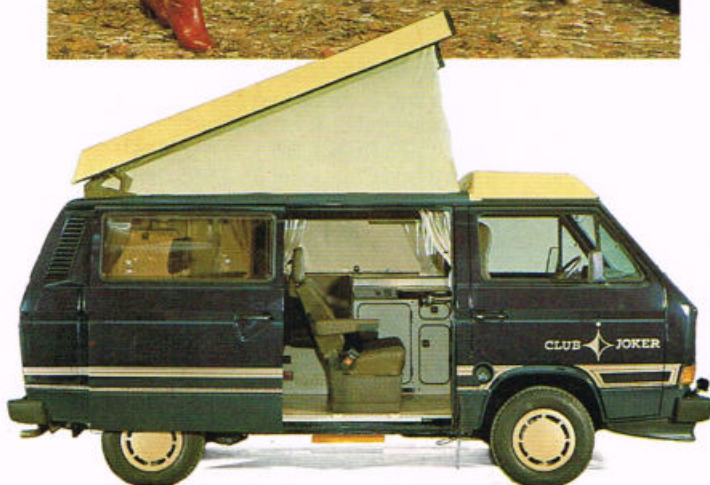
Club Joker 1

Bequemes Auto für Geschäftsreisen. Attraktiver Gästebus für Hotels und Ferienpensionen. Exklusives Wohnmobil. Mit Original Westfalia Aufstelldach und integrierter Dachgepäckwanne vorn.