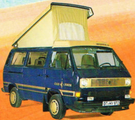
Club Joker 1