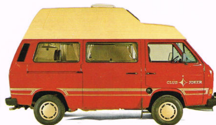
Club Joker 3

den Club Joker 1 schon für DM 40.457,-* *(unverbindl. Preisempfehlung)