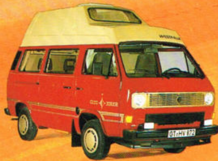
Club Joker 3

Auto für alle Tage. Fahrzeug für Geschäft und Hobby. Wohnmobil für Ferien und Freizeit.